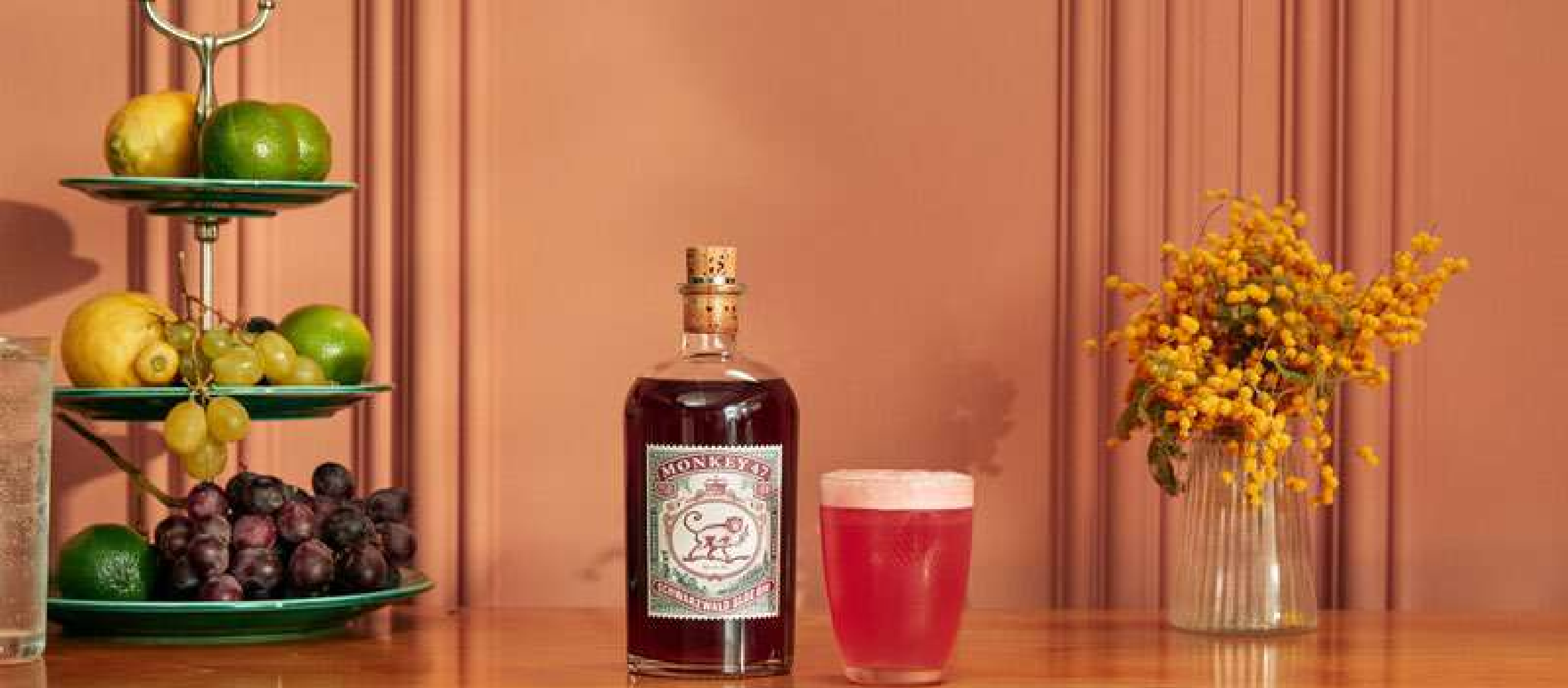
MONKEY 47 SCHWARZWALD SLOE GIN