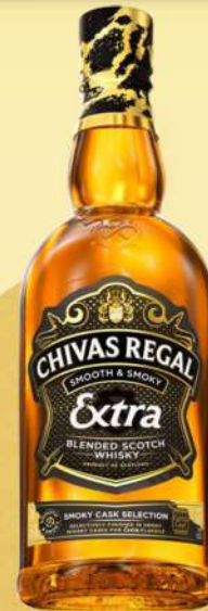
SMOXY CASK SELECTION