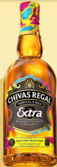
RUM CASK SELECTION