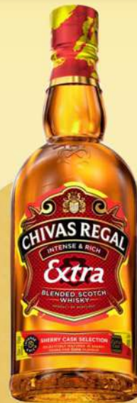
SHERRY CASK SELECTION