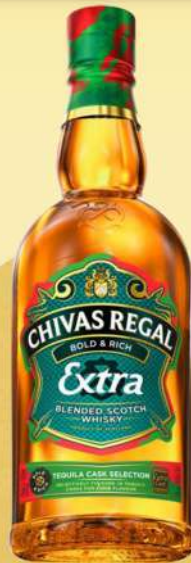
TEQUILA CASK SELECTION