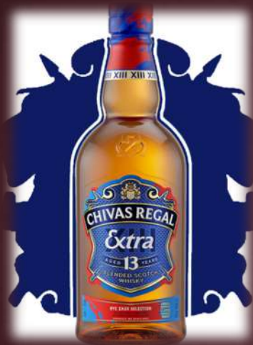
Rye (rozs) whisky hordós