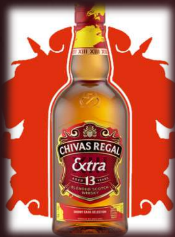
Sherry boros hordós