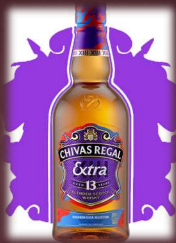
Bourbon whiskey hordós