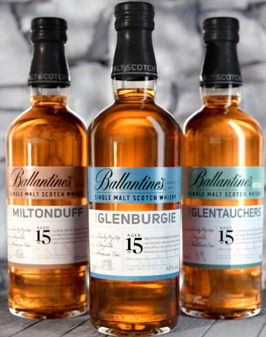
Miltonduff – Glenburgie - Glentauchers